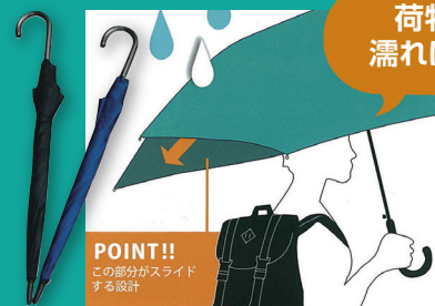
② スライド設計 傘(ブラック・ネイビー)