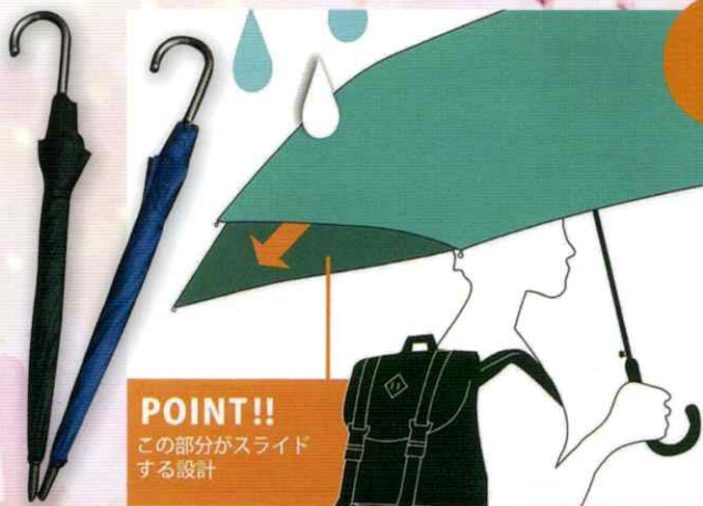
② スライド設計 傘(ブラック・ネイビー)